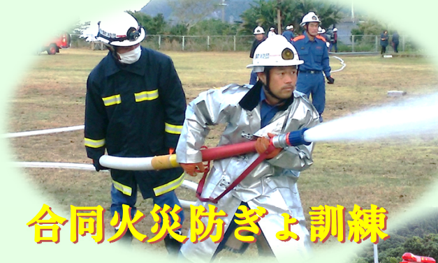
合同火災防ぎょ訓練

この運動は地域住民の防火意識の高揚を目的に、防火パレードなどの防火広報や自治会などでの防災訓練が実施されます。また、消防署と関係機関との合同火災防ぎょ訓練も実施されます。ご家庭でも、消火器や住宅用火災警報器の点検を行うとともに、火の取扱いには十分注意してください。