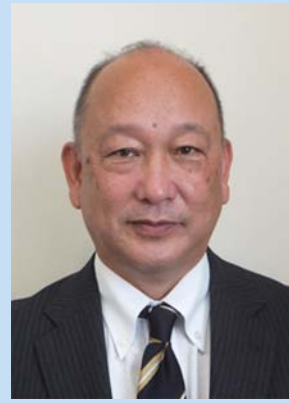
大隅肝属地区消防組合