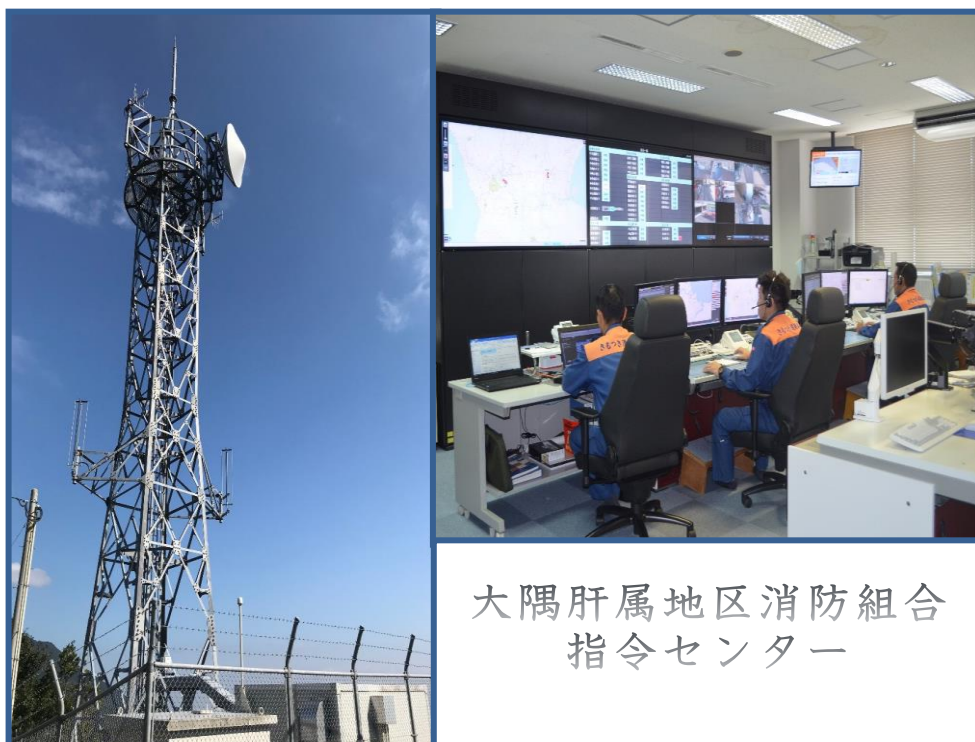
大隅肝属地区消防組合 指令センター