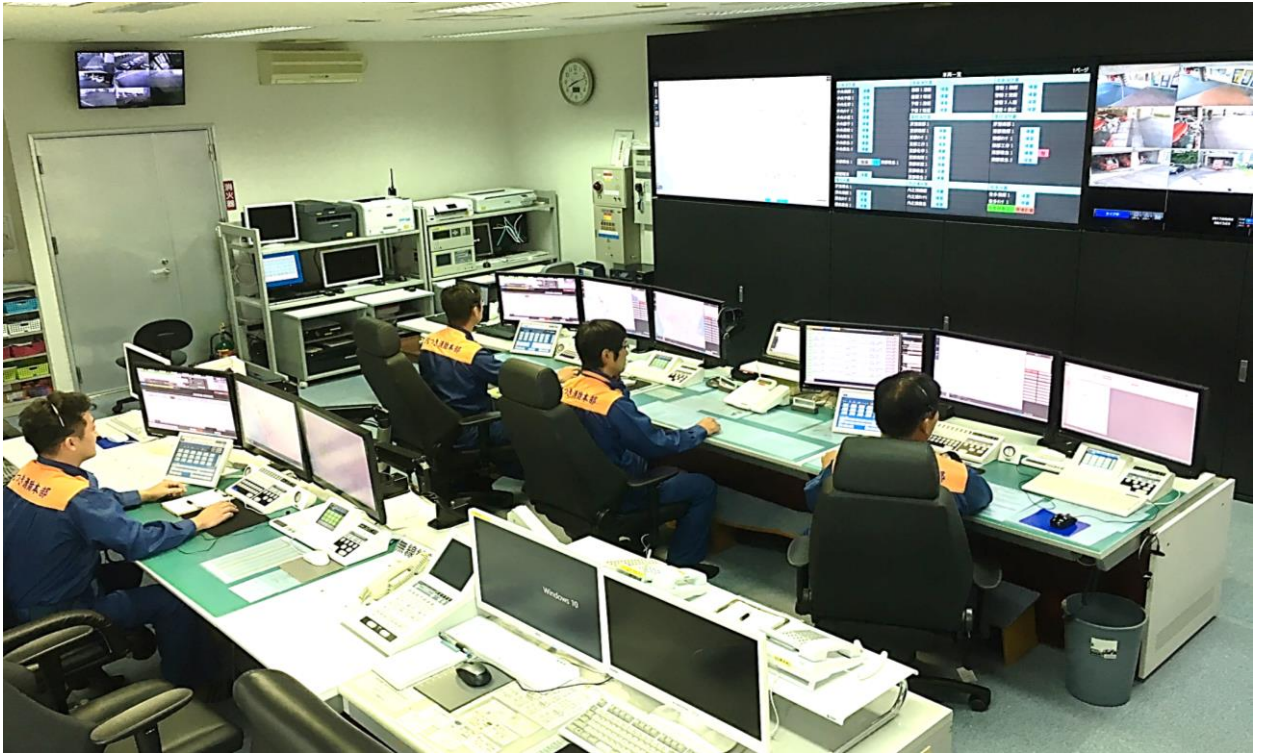
新システムへ完全移行した指令台の様子