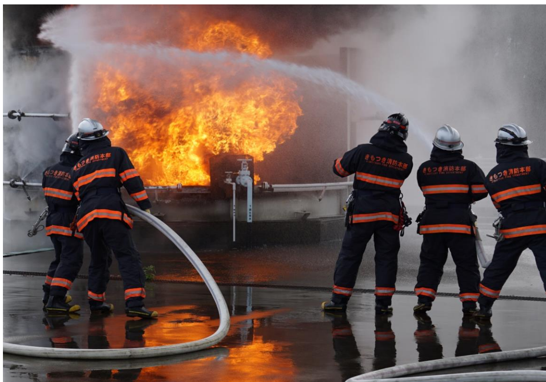
志布志国家石油備蓄基地での訓練の様子