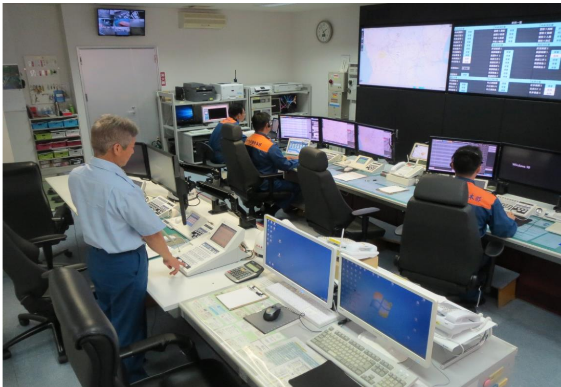
通信指令室内の業務風景