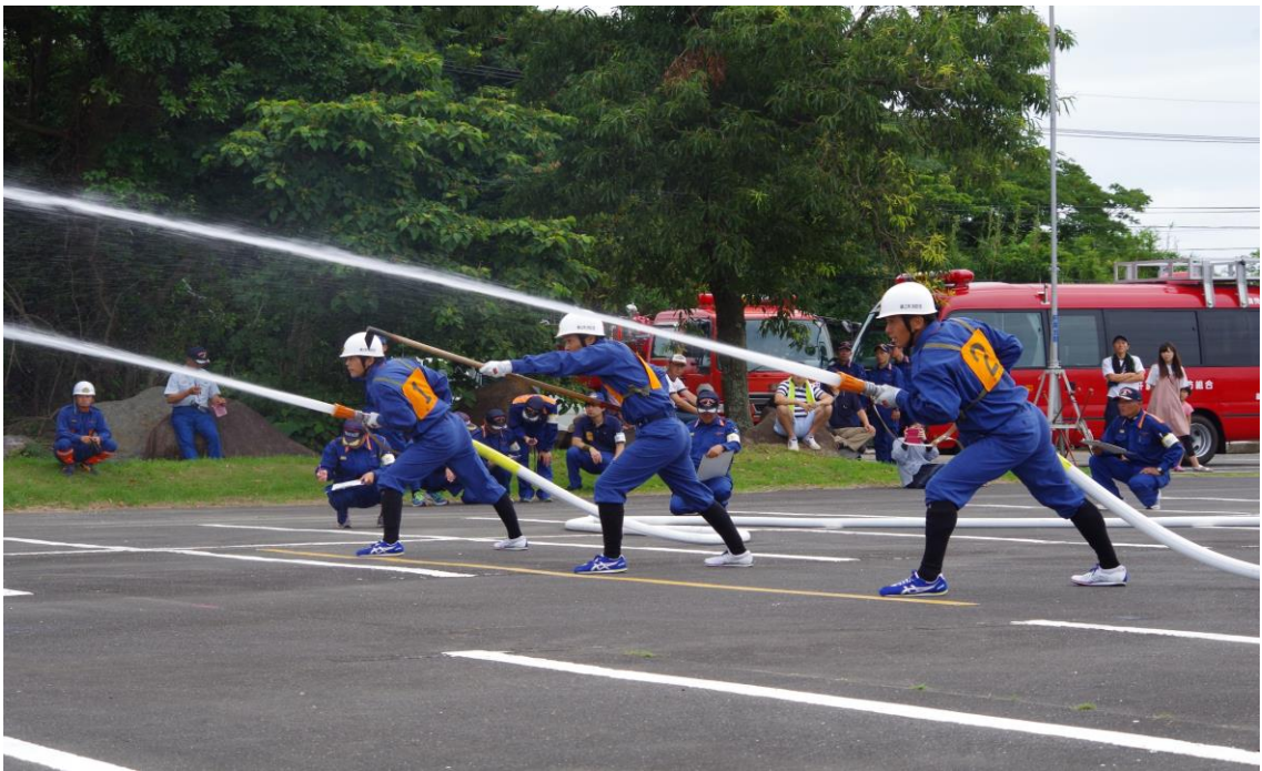
消防操法大会の様子