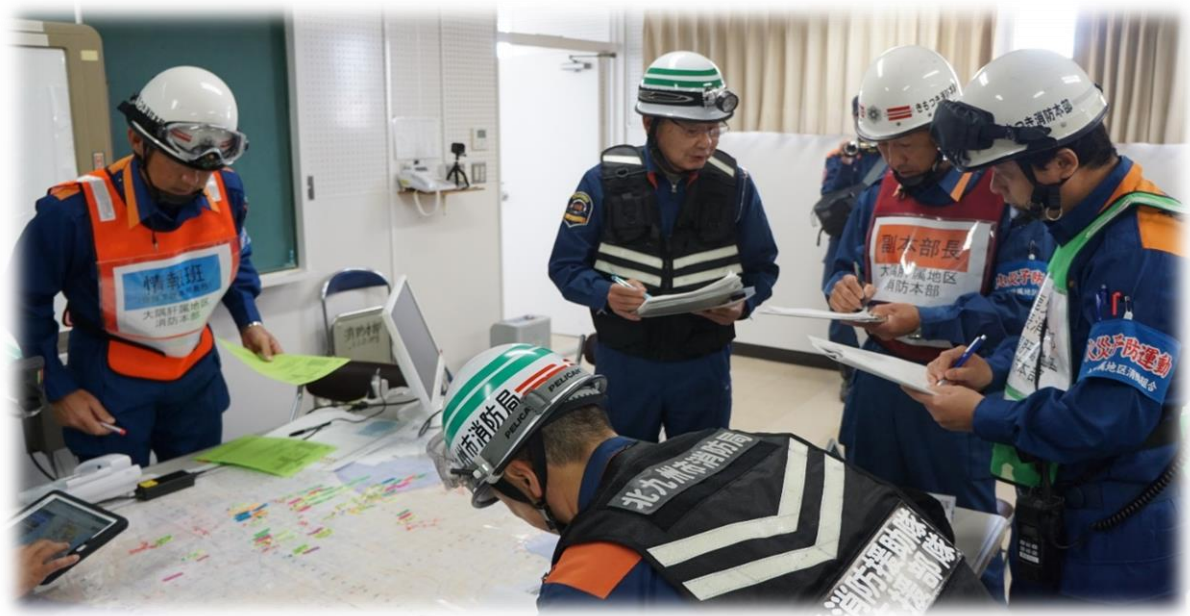
大規模災害想定での受援訓練の様子