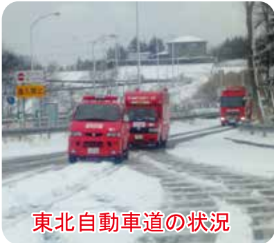
東北自動車道の状況

被災地へは主に高速道路 を使用し、東北自動車道に 入ると、災害対策基本法に よる交通規制や、地震によ る亀裂、降雪による障害等