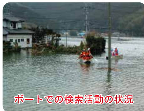
ボートでの検索活動の状況

学校付近の水没した集落の 検索にあたりましたが、活 動期間の中では生存者の発 見には至らず、残念な思い のまま石巻市をあとにする こととなりました。