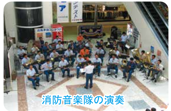
消防音楽隊の演奏

このコンテストは二人一組で編成し、心肺蘇生法の実施とAED(自動体外式除細動器)を使用する担当と、一九番の通報と心肺蘇生法を実施する担当に分かれて、それぞれの操作の確実性と迅速性を救急救命士が審査しました。 各チームとも手際よく処置するとともに、的確な心肺蘇生法とAEDの操作が行われました。 最後は、大隅肝属地区消防組合音楽隊による演奏で締めくくられ、多くの家族連れで賑わいました。