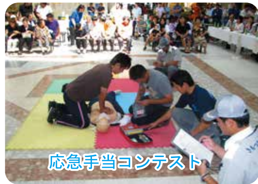
応急手当コンテスト

ローズクイン鹿屋を一日救急隊長に迎えて、消防車両及び救急資機材の展示や心肺蘇生法とAEDの指導などがあり買い物客へ応急手当の重要性を呼びかけました。 応急手当コンテストでは住民への応急手当の普及を目的とし、普通救命講習修了者を対象に、各事業所から十一チームの参加がありました。また、仕事を終えた後に、消防署に立ち寄るなどして練習に励み本番にのぞまれました。