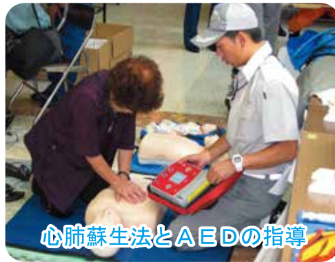
心肺蘇生法とAEDの指導

救急医療週間を前に八月二十八日、中央消防署主催により、プラッセデザイン工房で第十七回救急フェアが開催されました。