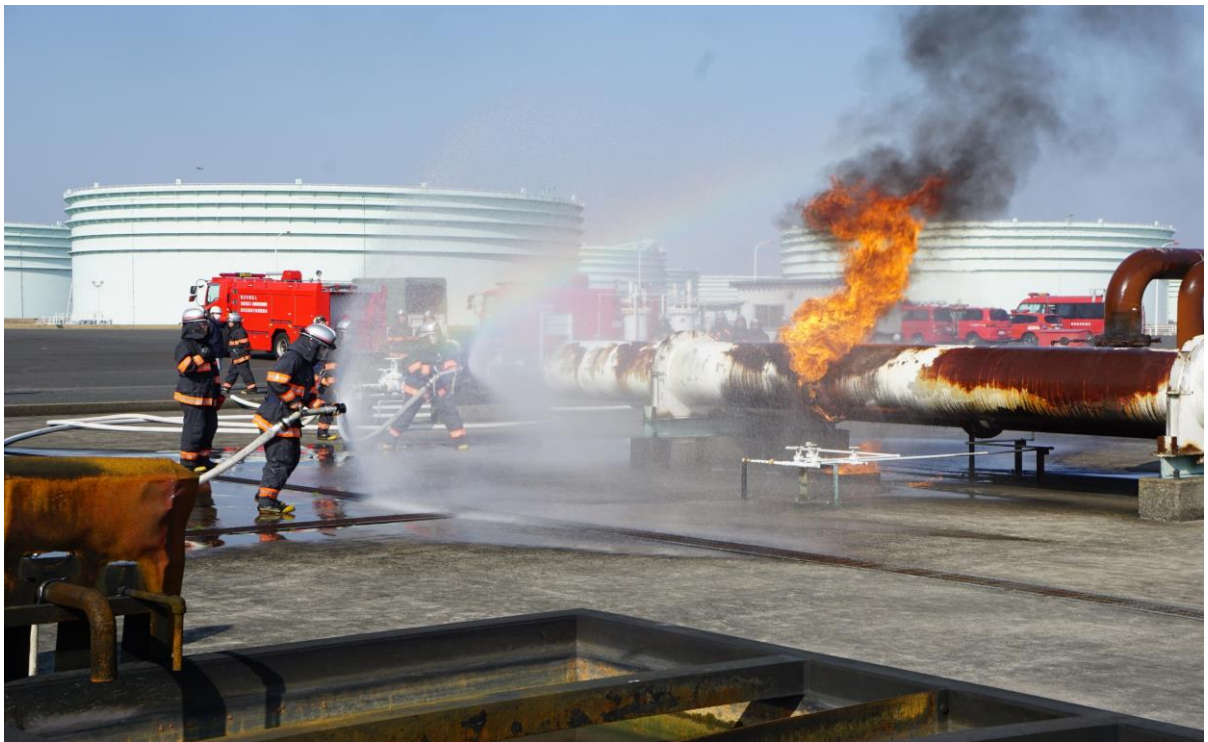
志布志石油備蓄基地での消火訓練の様子