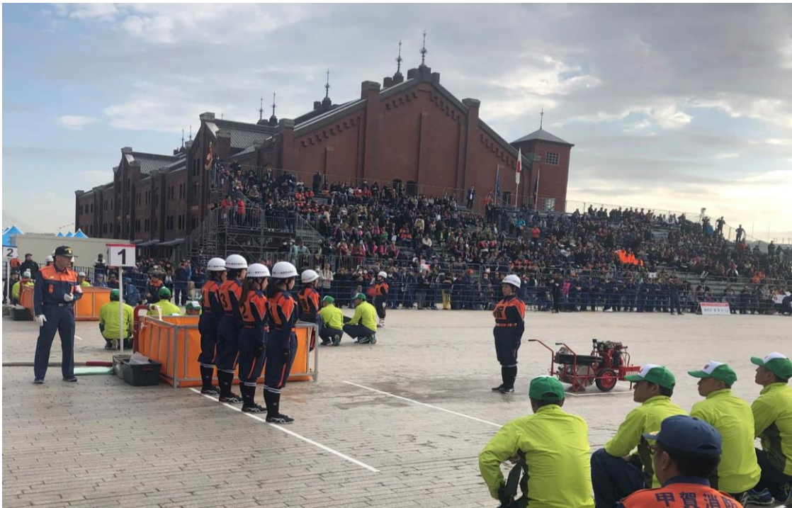
全国女性消防操法大会の様子