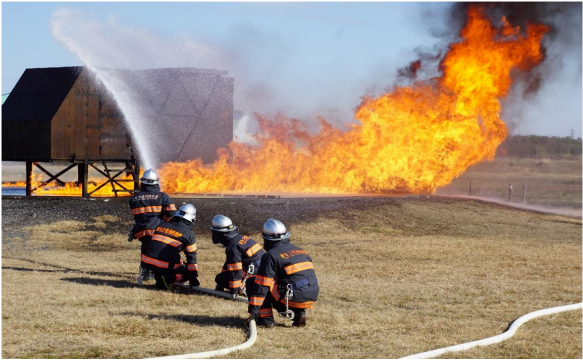
各種警防訓練の様子