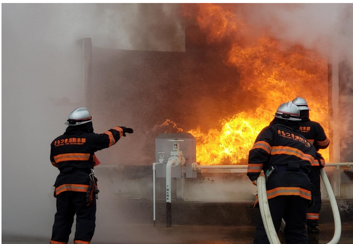
各種警防訓練の様子