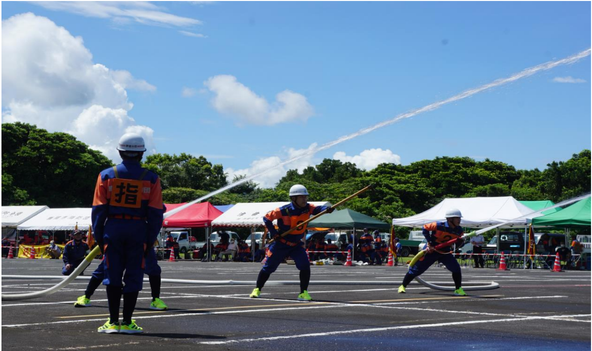
肝属支部消防操法大会の様子