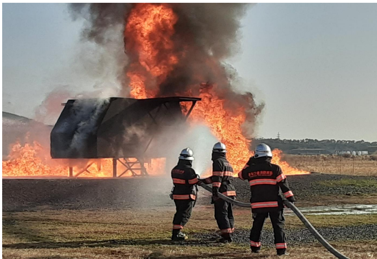
各種警防訓練の様子 (航空機火災対応訓練の様子)