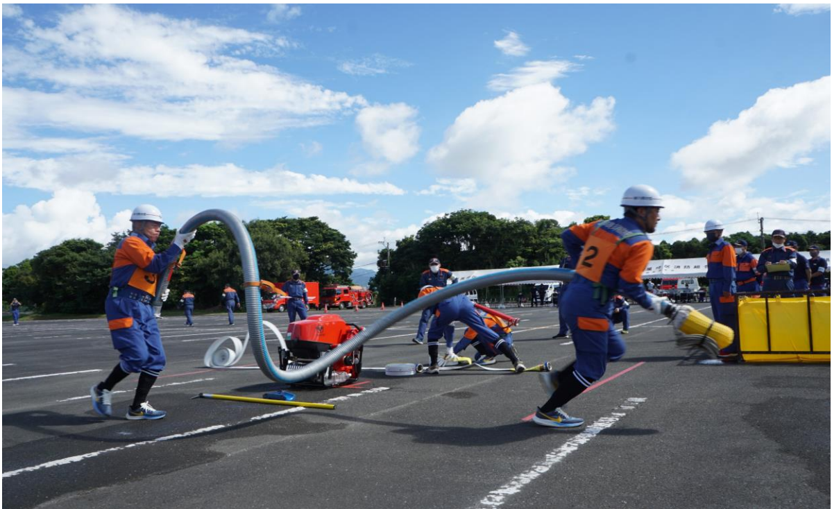
肝属支部消防操法大会の様子