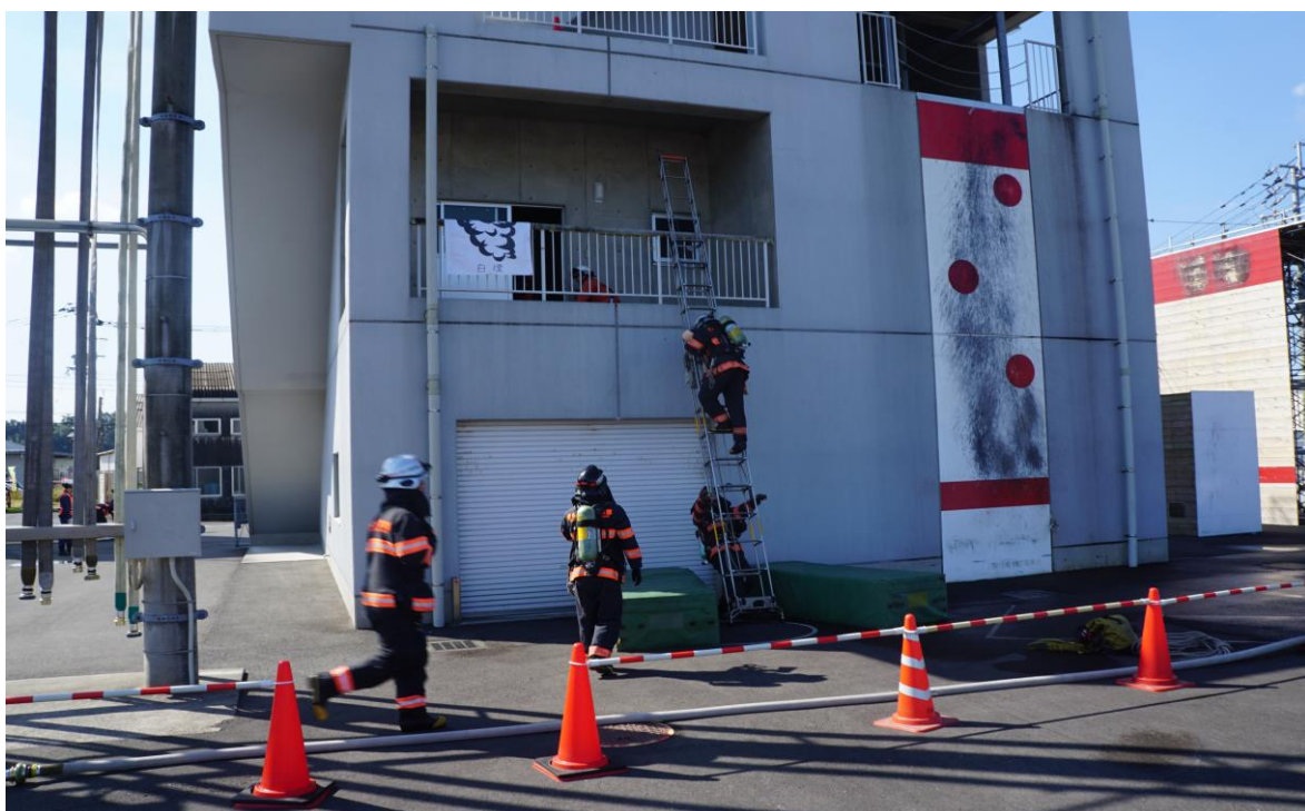
各種警防訓練の様子