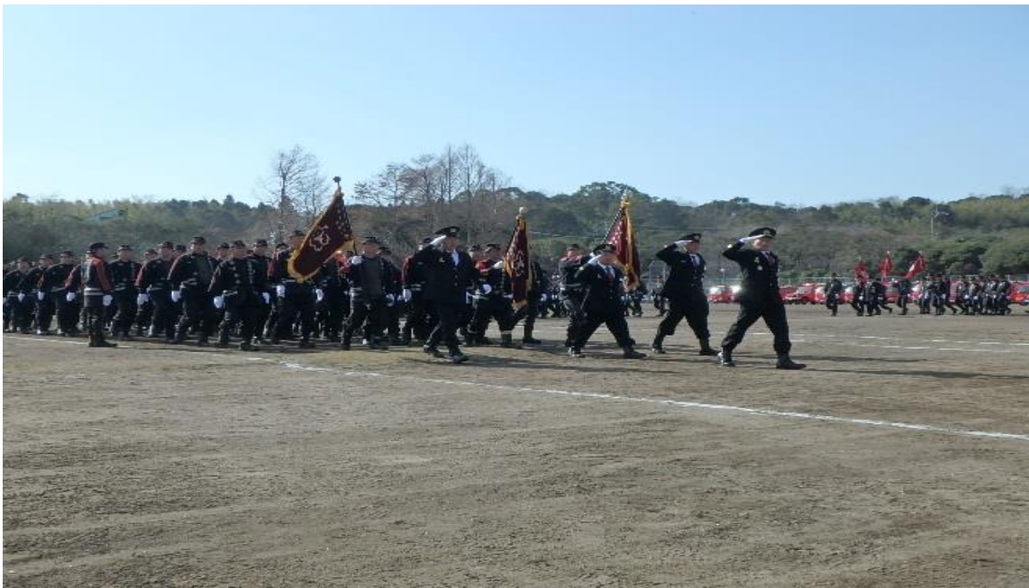
出初め式での分列行進の様子